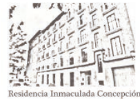
Residencia Inmaculada Concepción

¿Quiénes somos? Somos un centro privado en el que se presta alojamiento, alimentación y atención integral necesaria a todas aquellas personas ya sean válidas o dependientes que requieran dichos servicios por estar excluidas de la sociedad o por no poder permanecer en su entorno familiar y social, bien sea por carencia o limitación de éste, con el fin de mejorar su calidad de vida.